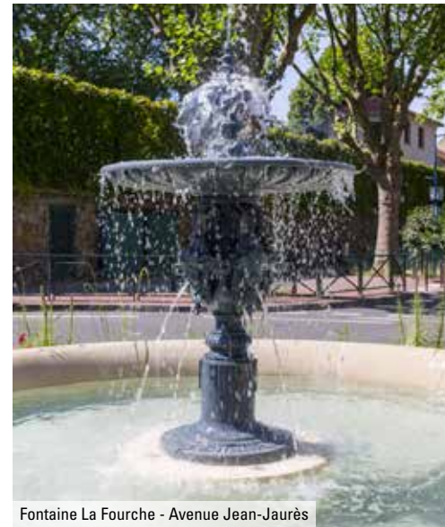
Fontaine La Fourche - Avenue Jean-Jaurès