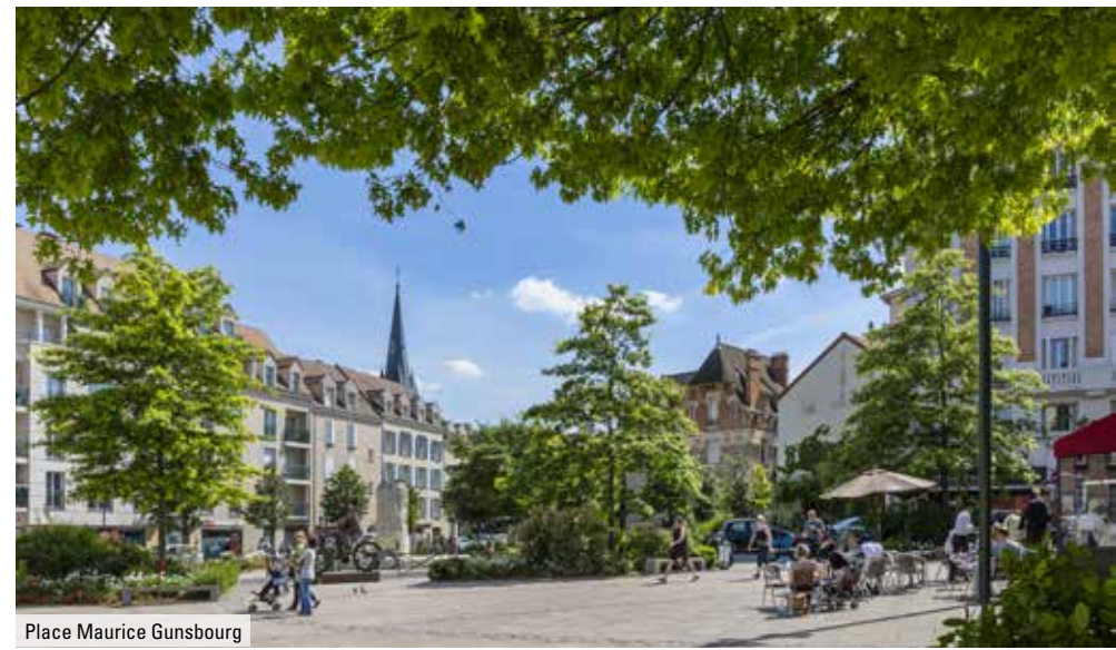
Place Maurice Gunsbourg