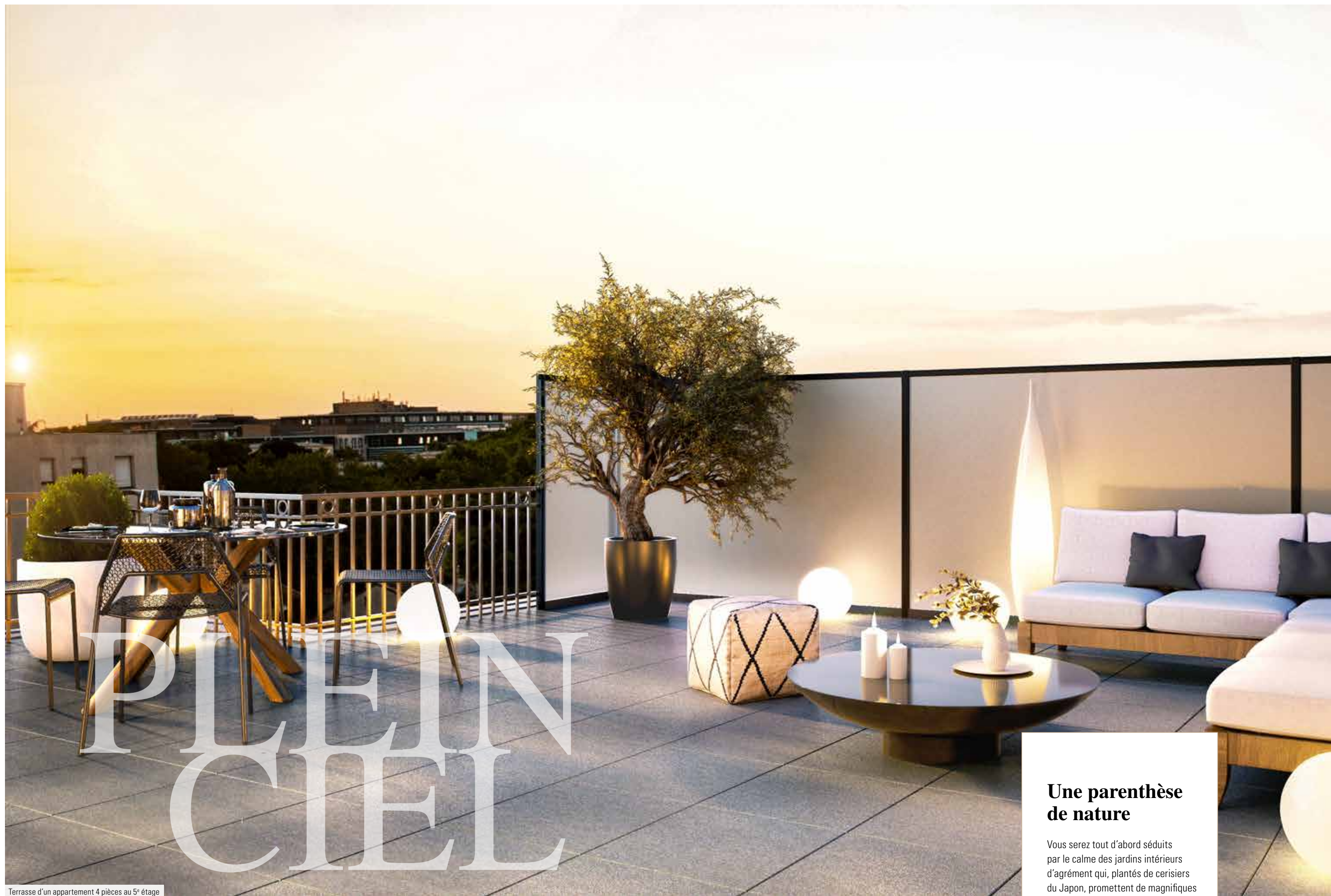
Terrasse d'un appartement 4 pièces au 5 e étage