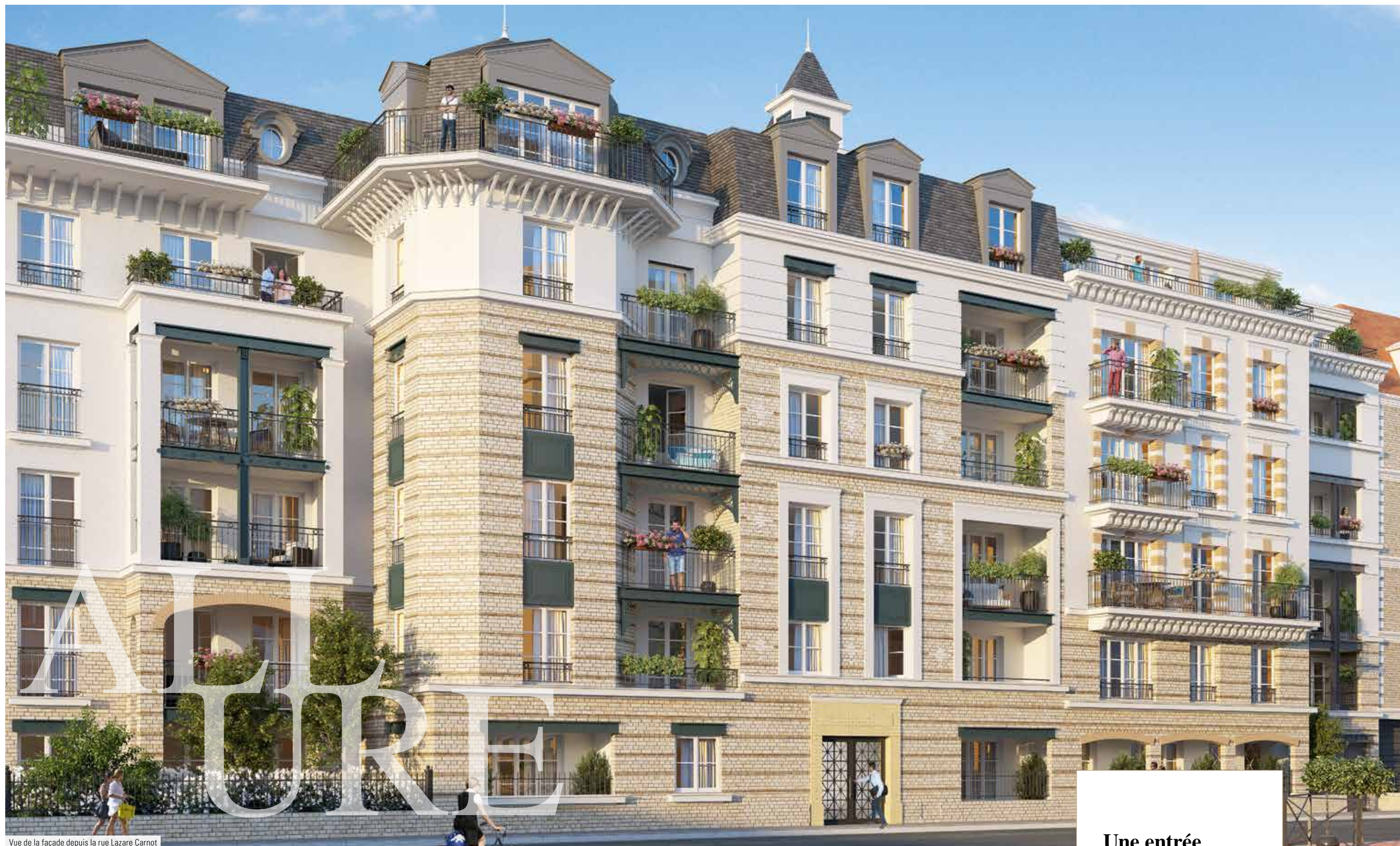
Vue de la façade depuis la rue Lazare Carnot