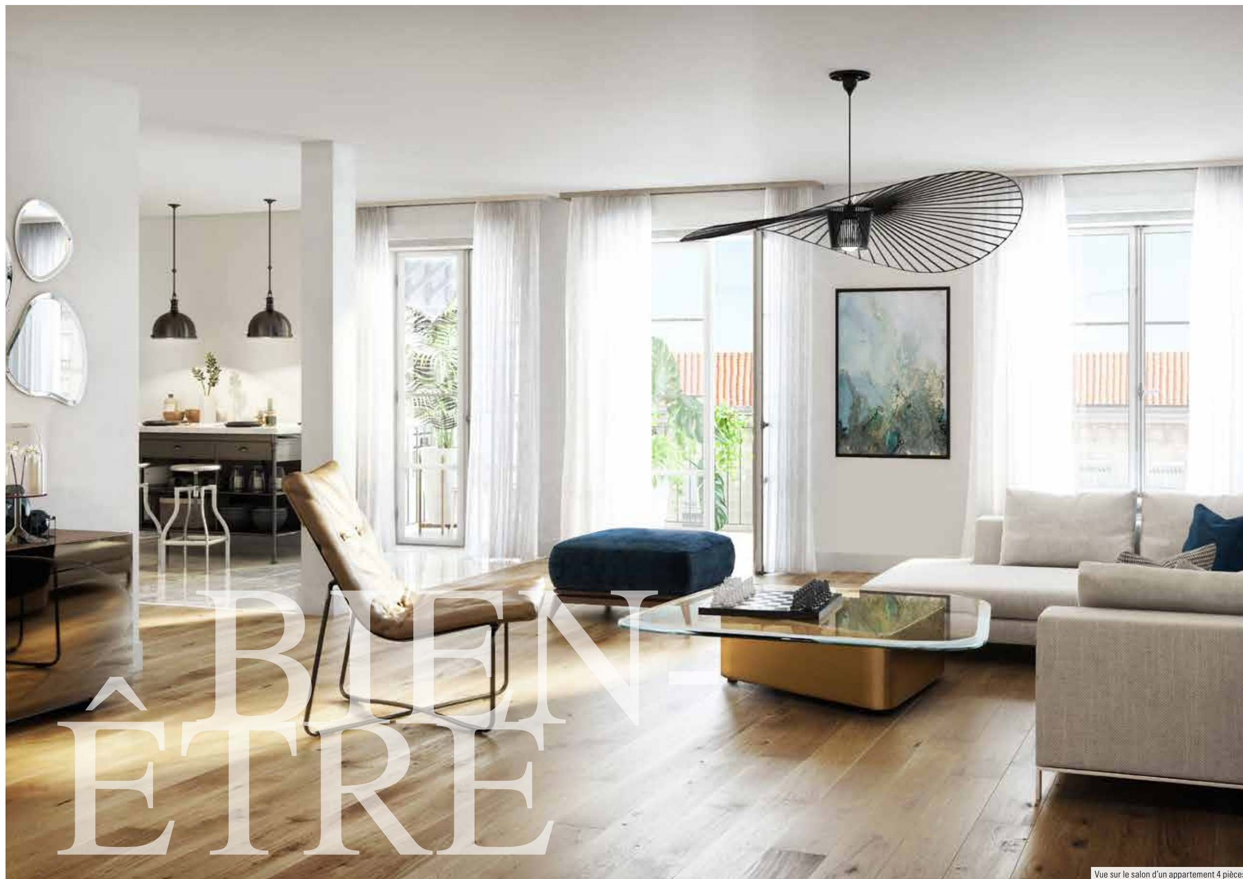
Vue sur le salon d'un appartement 4 pièces

Mon Coach Personnalisation by KAUFMAN & BROAD