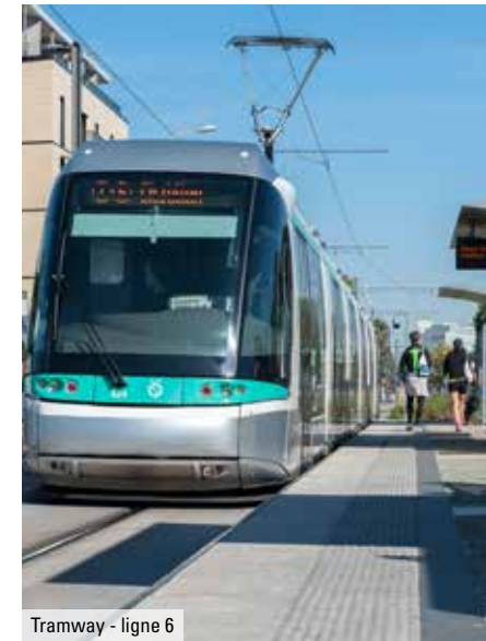
Tramway - ligne 6