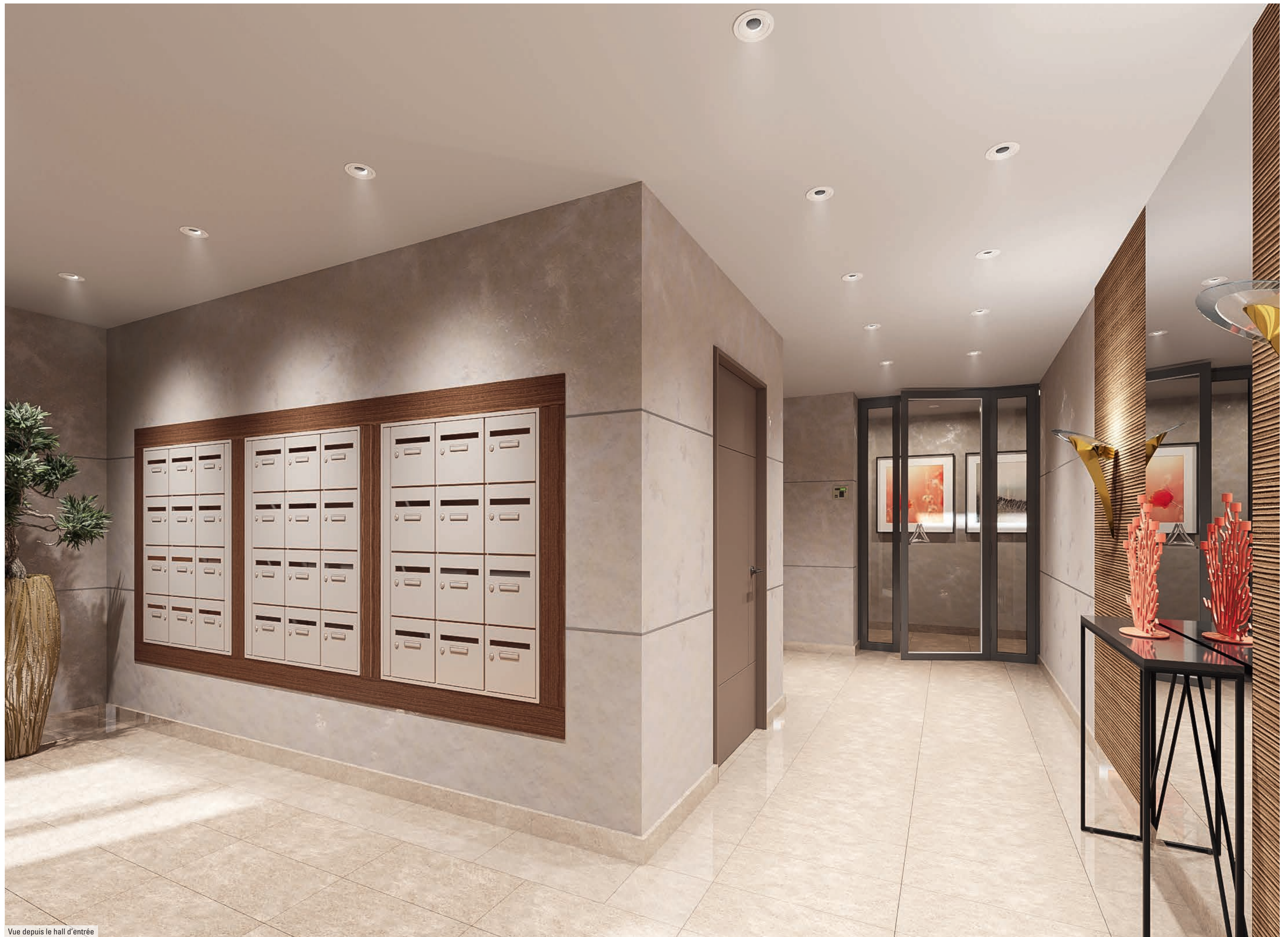
Vue depuis le hall d'entrée

Apprécier chaque jour le style sobre et contemporain de son hall d'entrée, c'est ça l'expérience Kaufman & Broad.