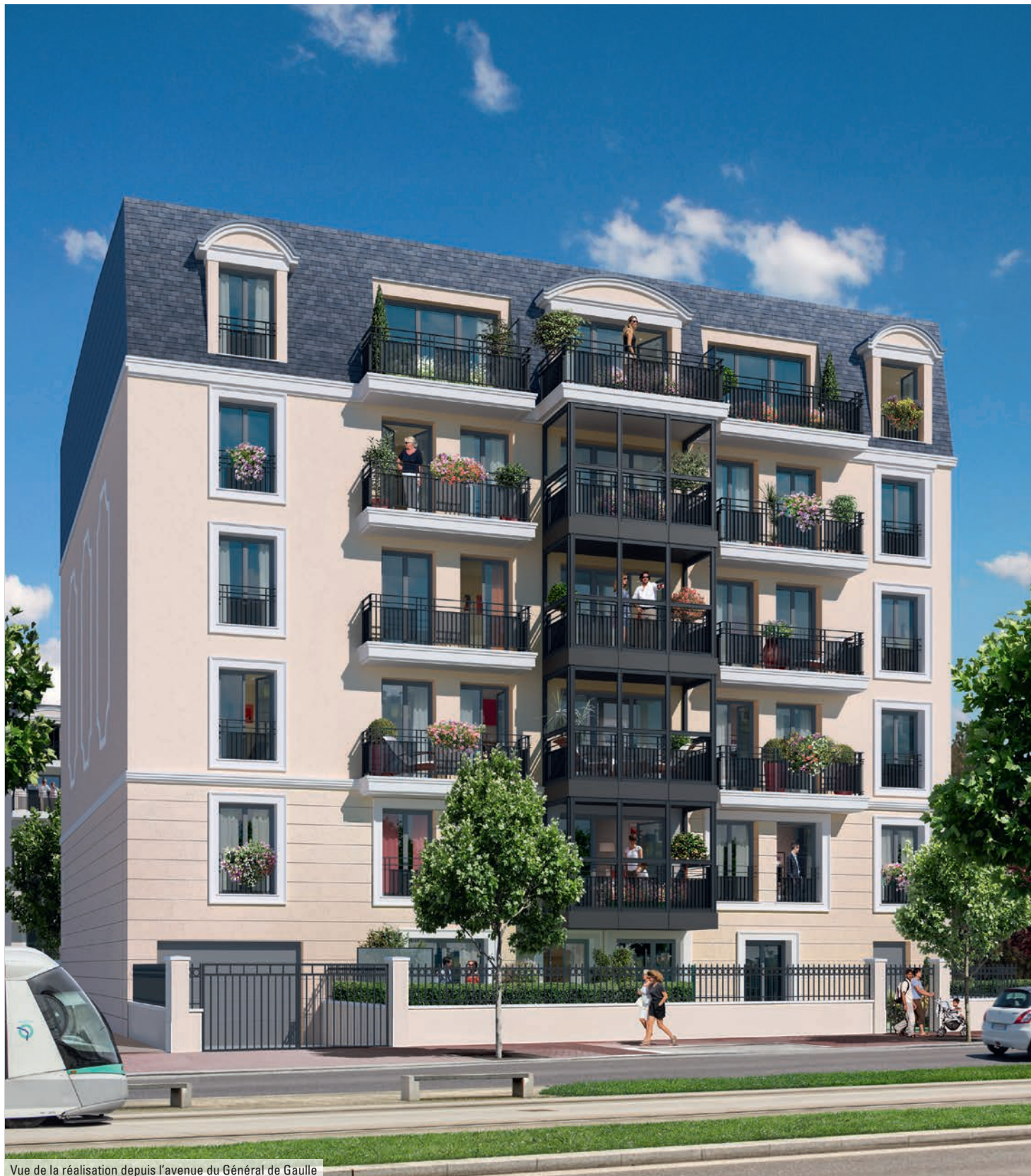
Vue de la réalisation depuis l'avenue du Général de Gaulle