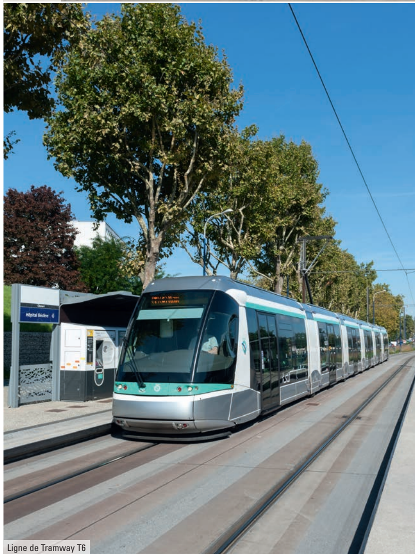
Ligne de Tramway T6