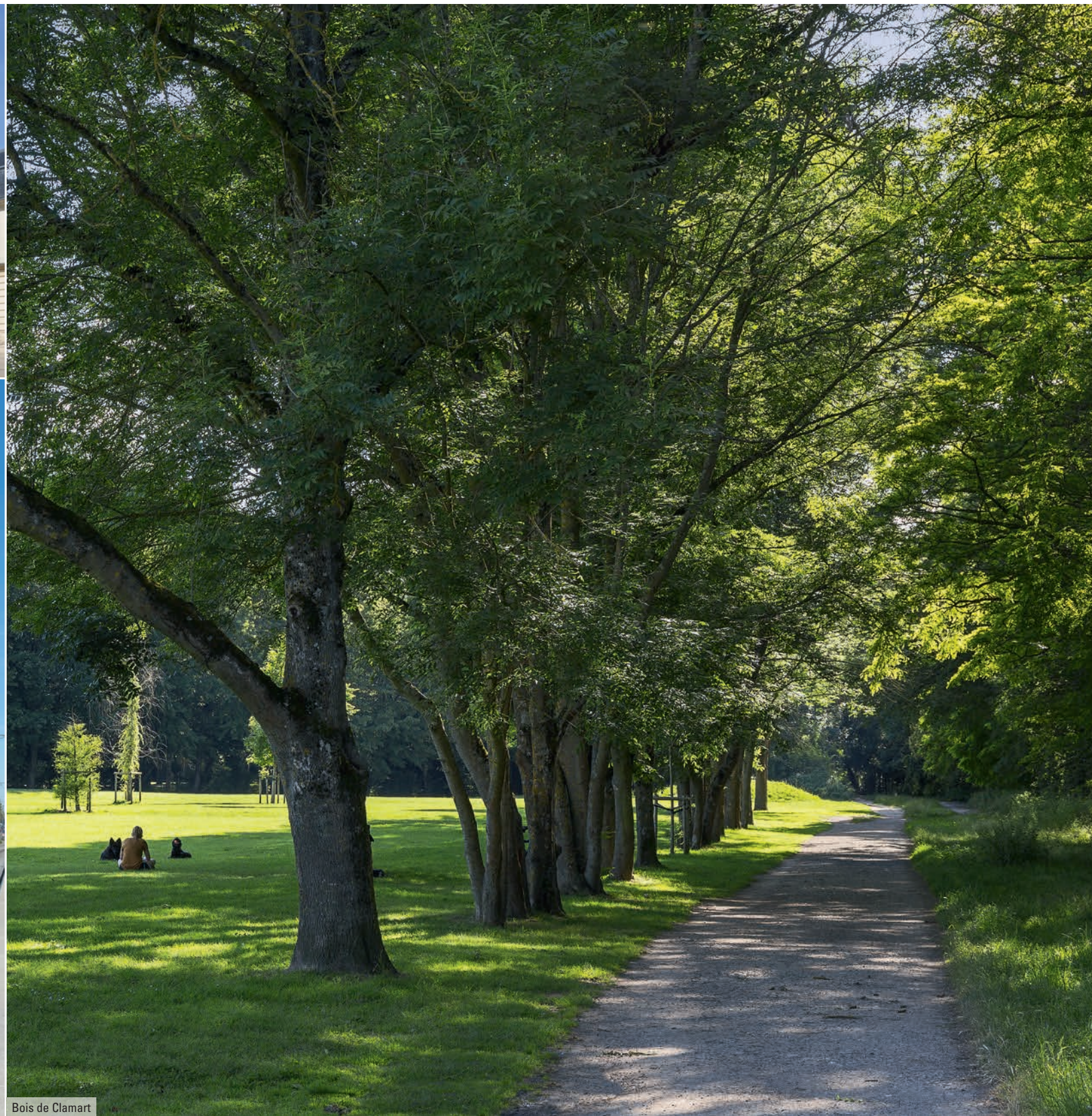
Bois de Clamart