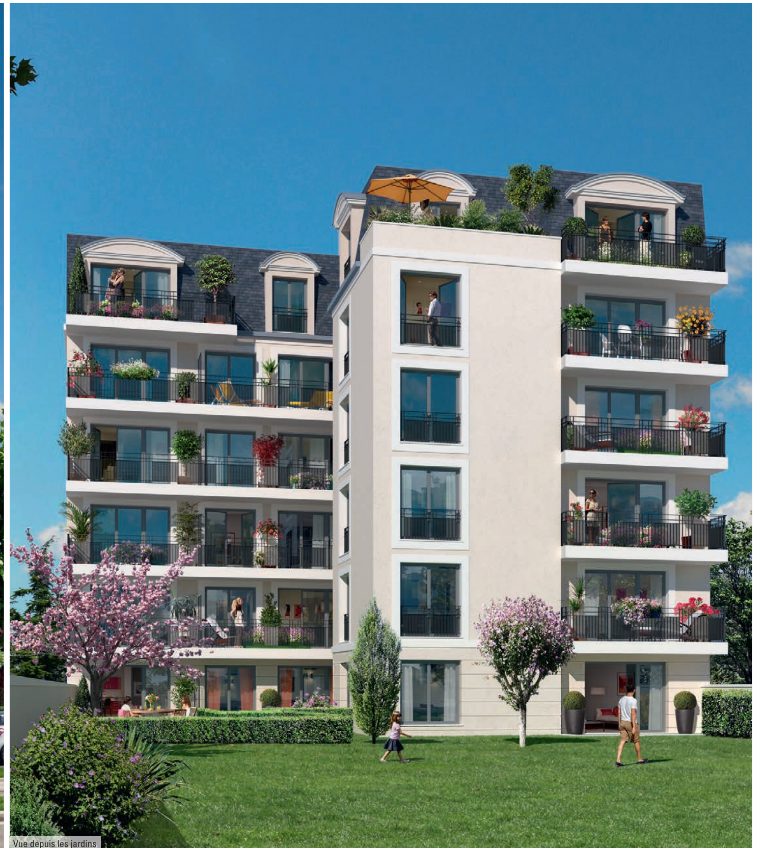
Vue depuis les jardins

Une réalisation à taille humaine offrant une douceur de vie préservée.