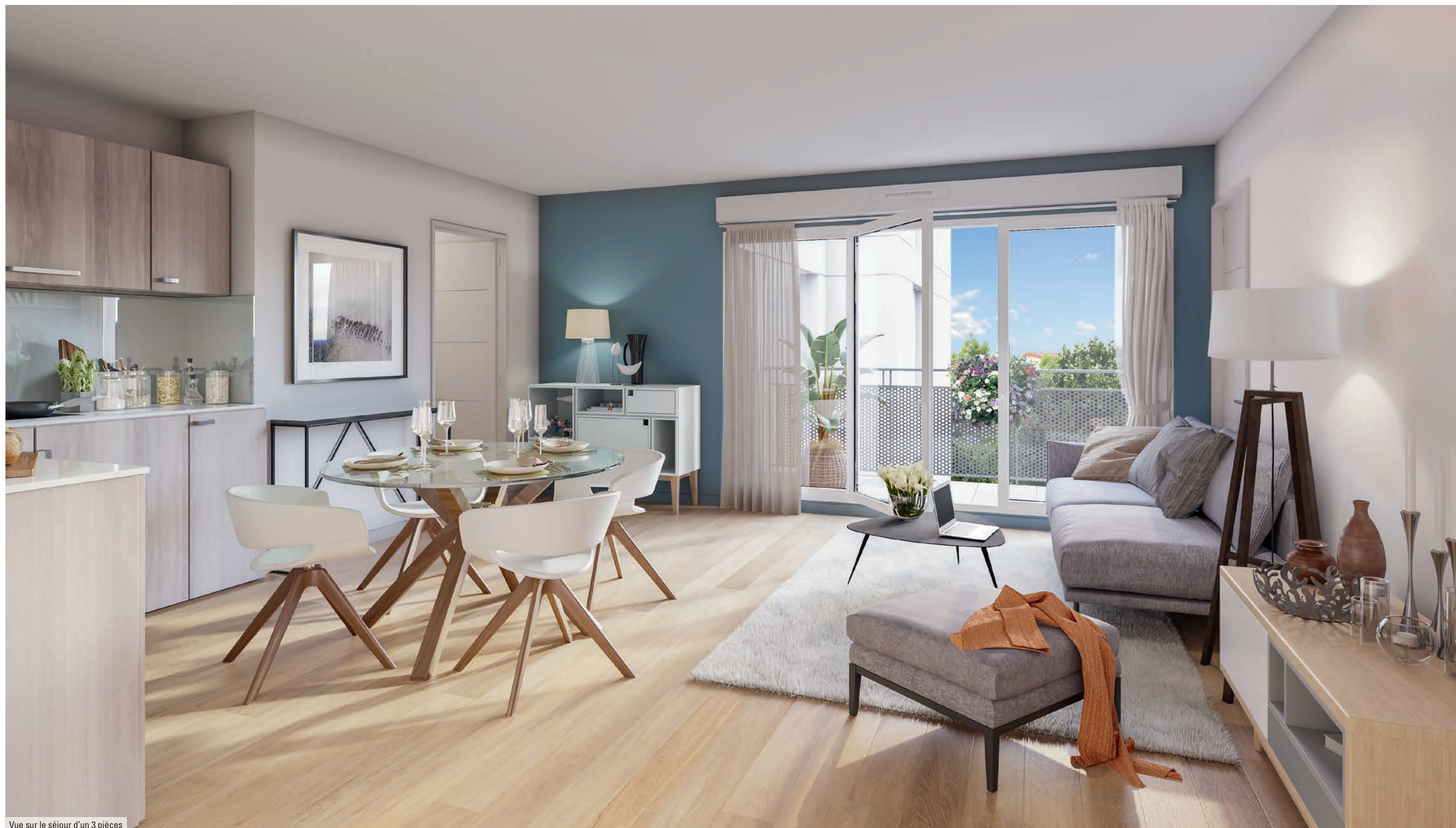
Vue sur le séjour d'un 3 pièces

Des aménagements conçus pour vivre au gré de vos envies !