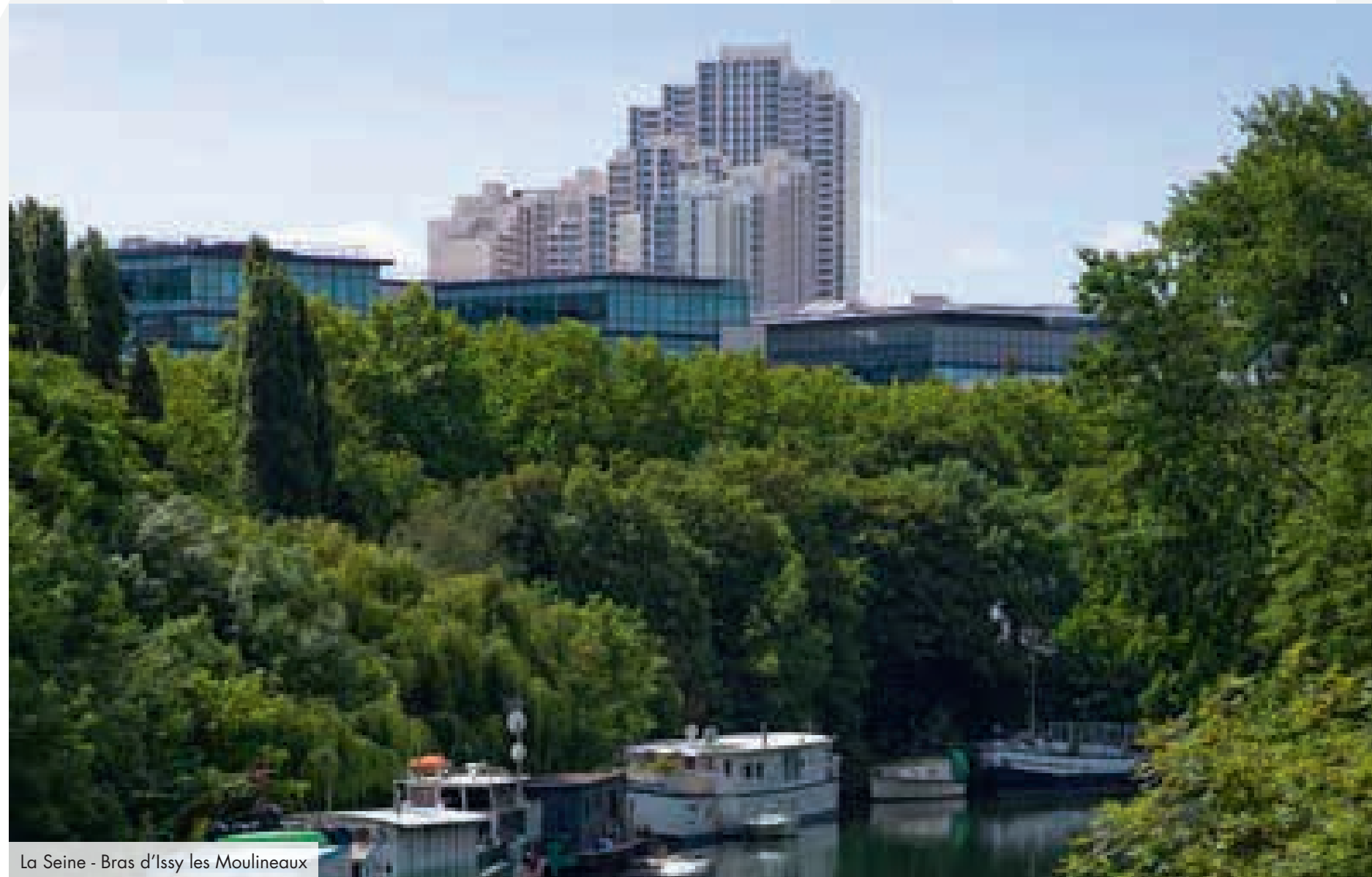
La Seine - Bras d'Issy les Moulineaux