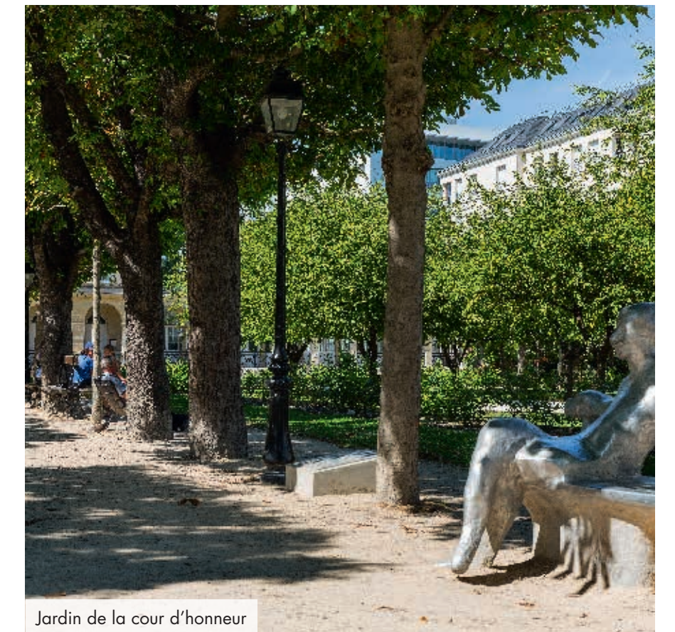
Jardin de la cour d'honneur