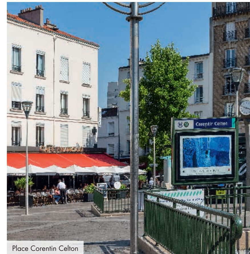
Place Corentin Celton

La profusion d'infrastructures culturelles et sportives en font la ville parfaite pour concilier plaisirs et commodités. Culture, sport, nature, équipements, LE CAP est une adresse de haut standing assurant toutes les facettes d'une vie de quartier épanouie.