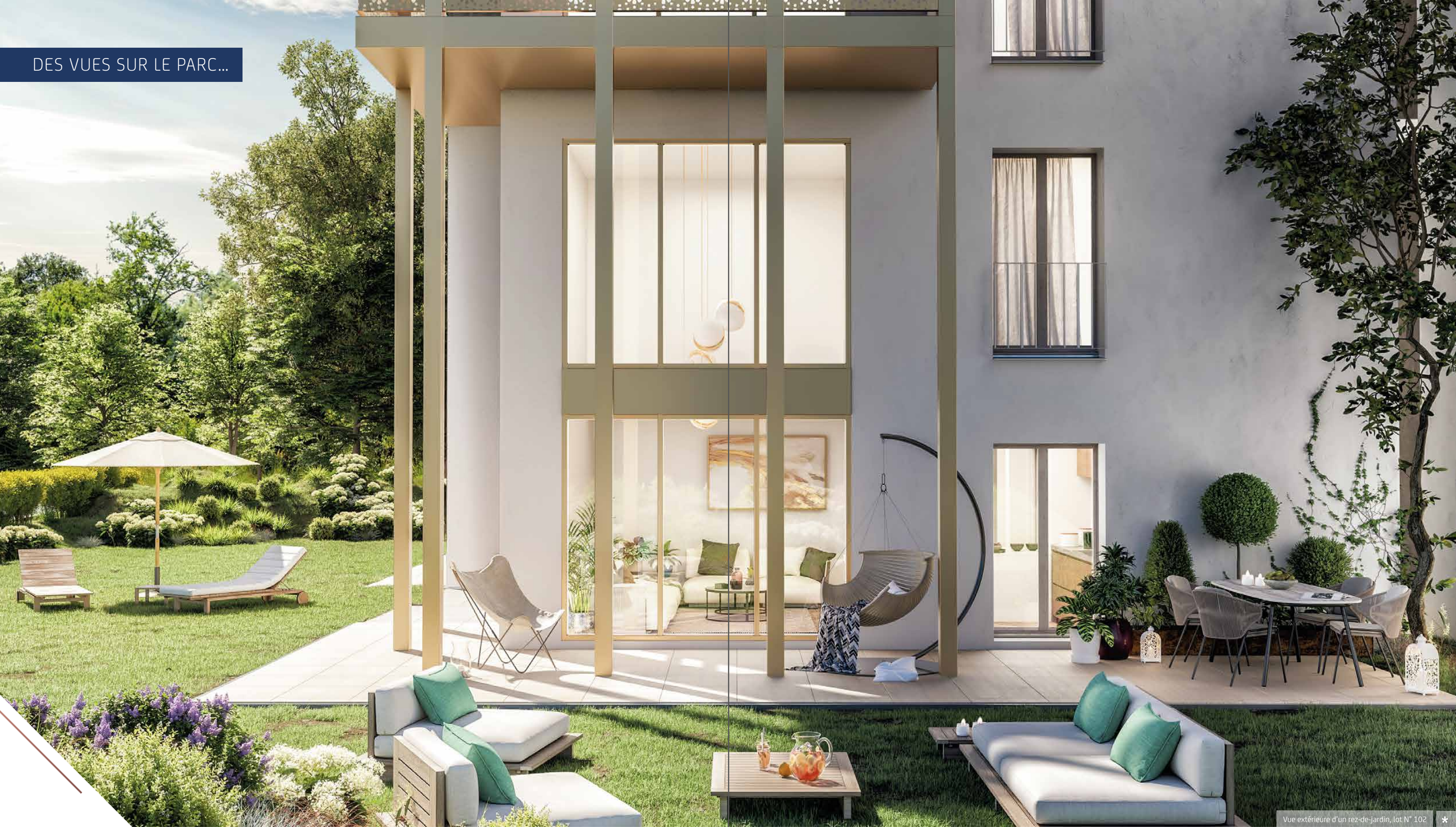
Vue extérieure d'un rez-de-jardin, lot N° 102 *