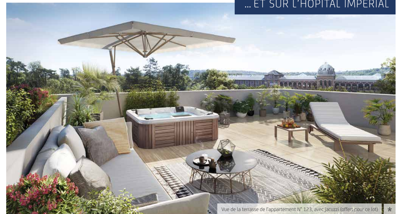
Vue de la terrasse de l'appartement N° 123, avec jacuzzi (offert pour ce lot) *