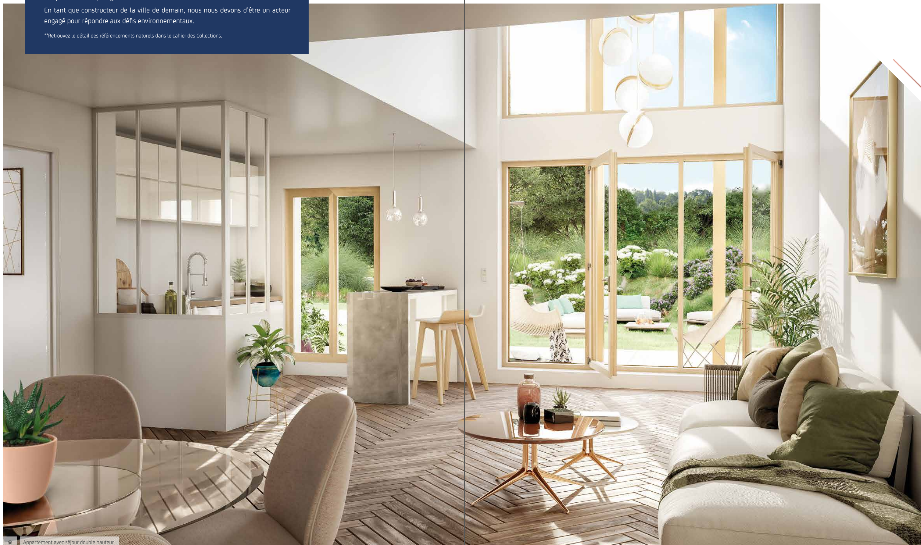
* Appartement avec séjour double hauteur

Pour encore plus de personnalisation, le cahier des Collections est disponible auprès de notre conseiller commercial