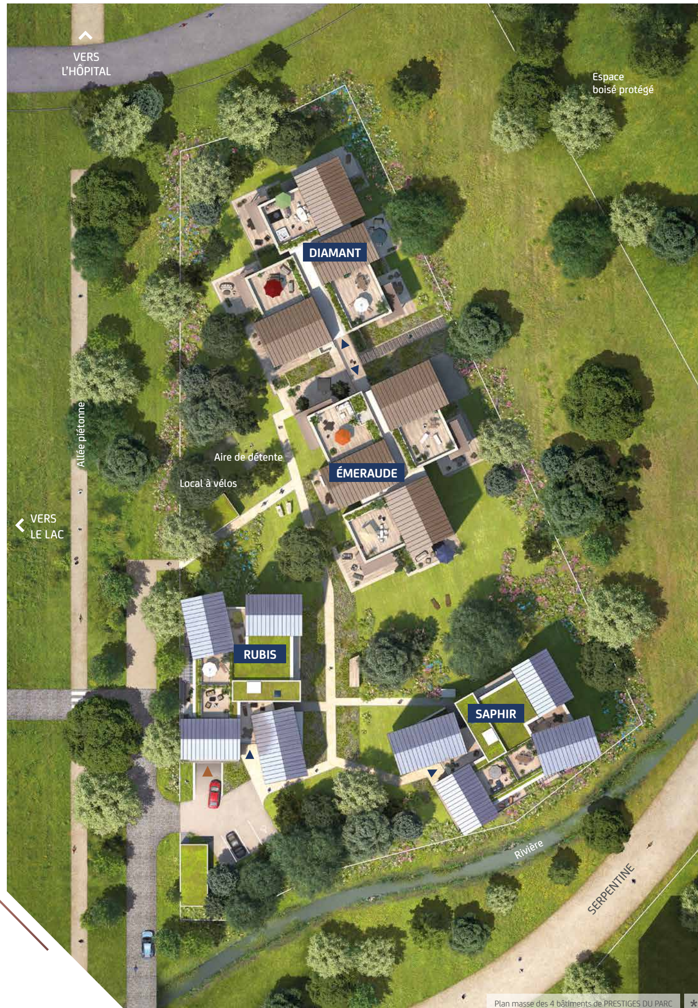
Plan masse des 4 bâtiments de PRESTIGES DU PARC *

▶ Accès parking sous-sol ▶ Accès hall d'entrée avec digicode et vidéophone