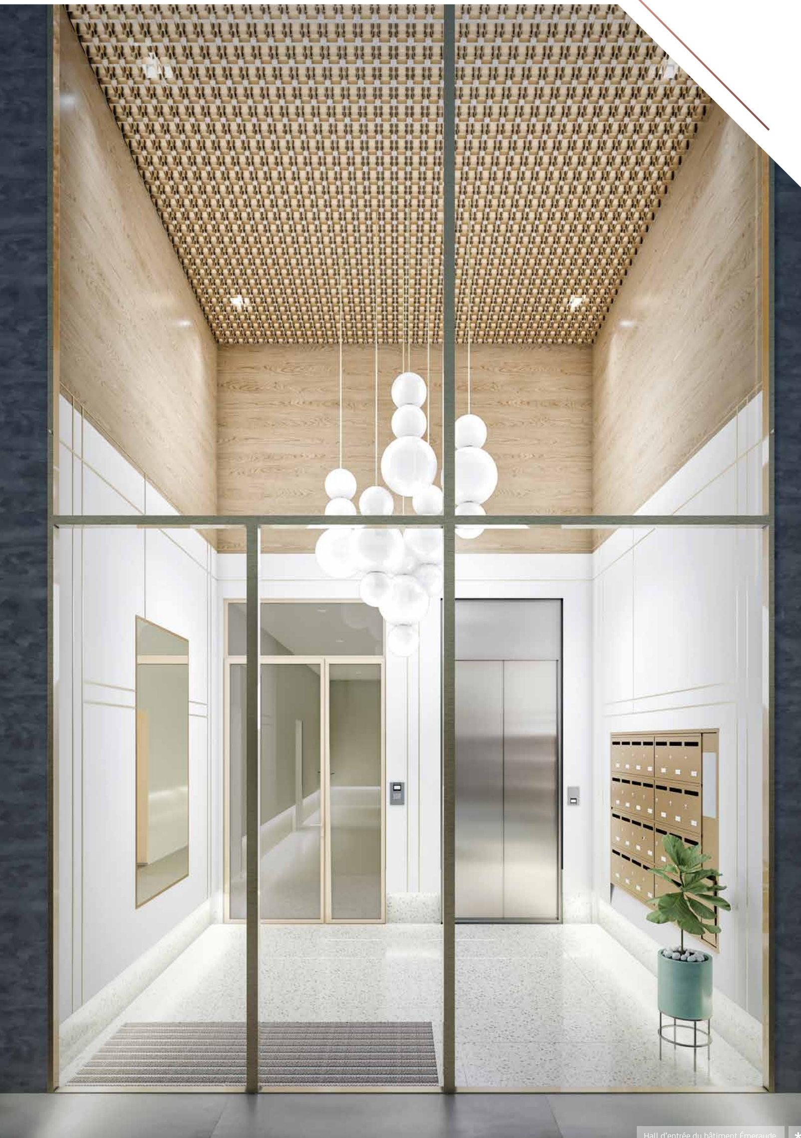
Hall d'entrée du bâtiment Émeraude *