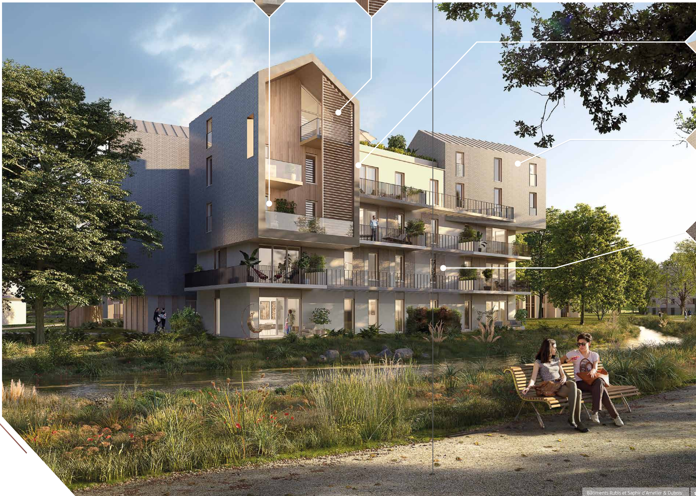
Brise-soleil coulissant métallique en tôle perforée

Contemporaine, l'architecture du Cabinet Ameller & Dubois est fondée sur l'équilibre entre la rigueur et l'audace. Elle s'adapte à notre temps, avec justesse et qualité.