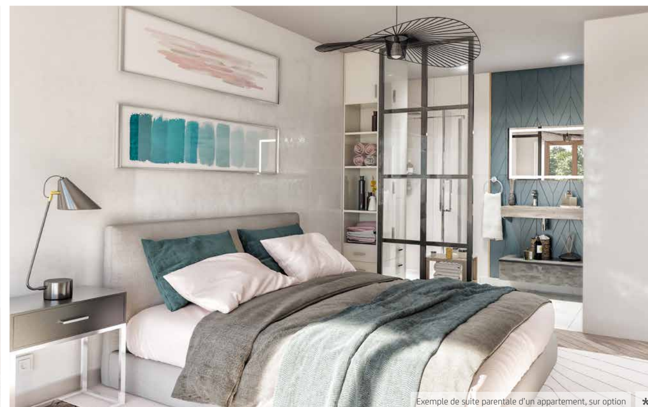
Exemple de suite parentale d'un appartement, sur option *