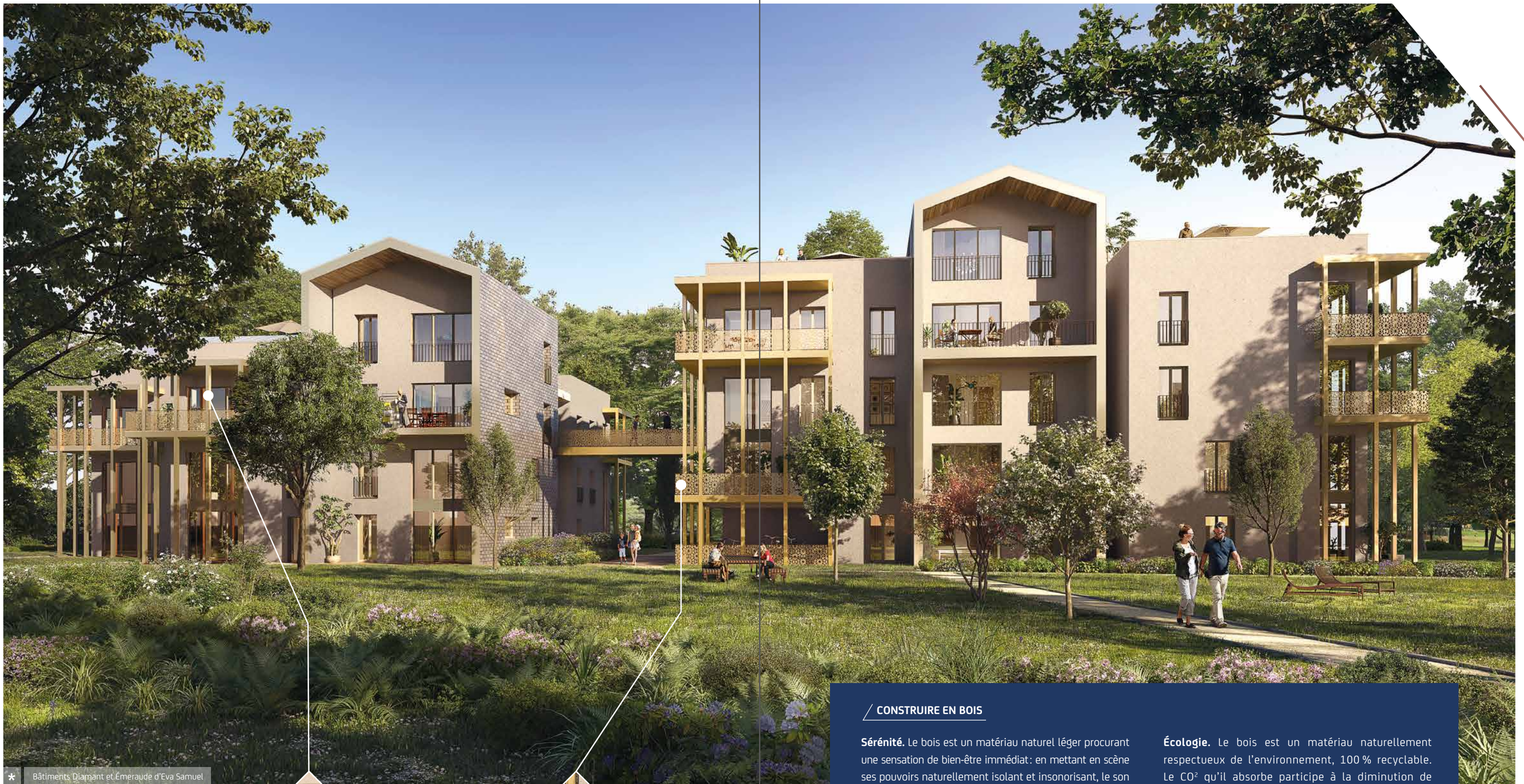
* Bâtiments Diamant et Émeraude d'Eva Samuel

Pergolas en acier thermolaqué teinte bronze