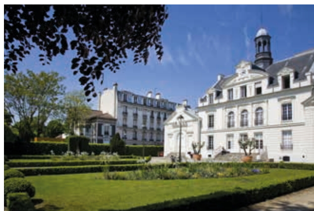
Le conservatoire de musique, de danse et d'art dramatique, un bâtiment du 19 e siècle