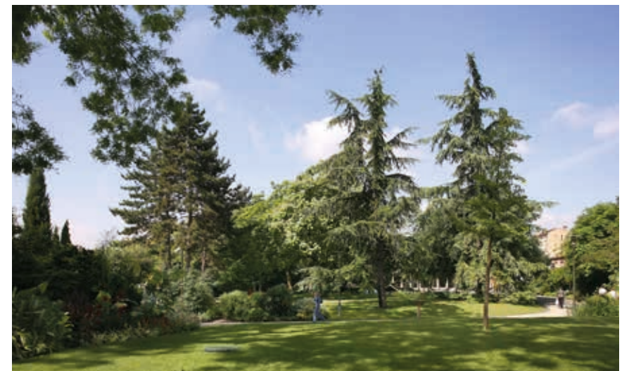
Le parc de l'Hôtel de Ville, paradis de verdure en plein centre-ville

À seulement 10 min de Paris, Argenteuil allie le charme du passé et les projets d'avenir, un environnement verdoyant très qualitatif et un cadre de vie animé.