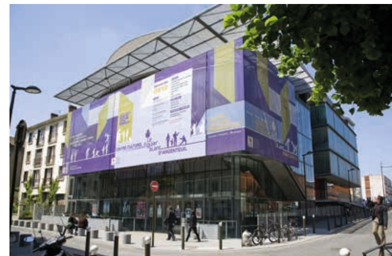
Le Figuier Blanc, une des salles de cinéma et de spectacle d'Argenteuil

Une adresse idéale pour profiter du meilleur d'Argenteuil !