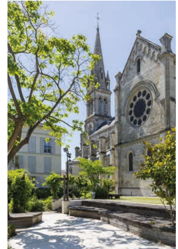
La basilique Saint-Denys, trésor d'architecture néo-romane.

À seulement 10 min de Paris, Argenteuil allie le charme du passé et les projets d'avenir, un environnement verdoyant très qualitatif et un cadre de vie animé.