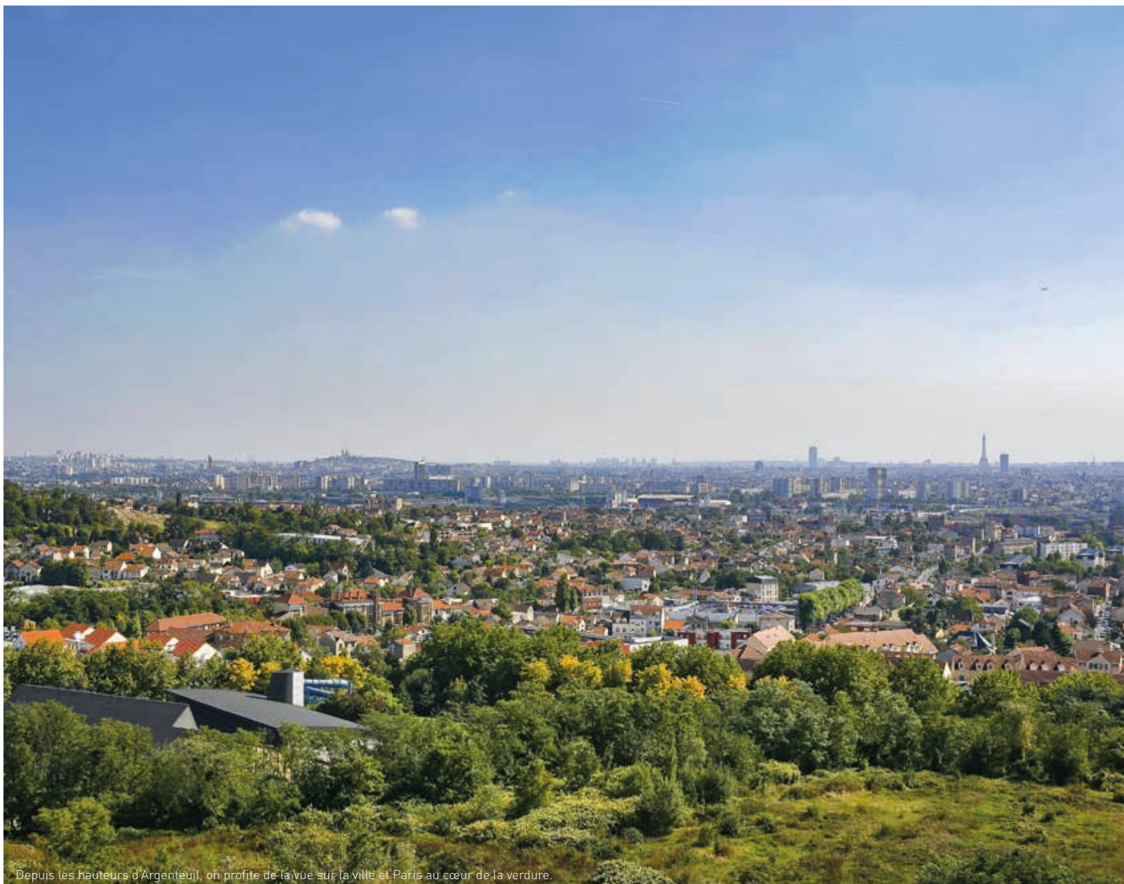
Depuis les hauteurs d'Argenteuil, on profite de la vue sur la ville et Paris au cœur de la verdure.