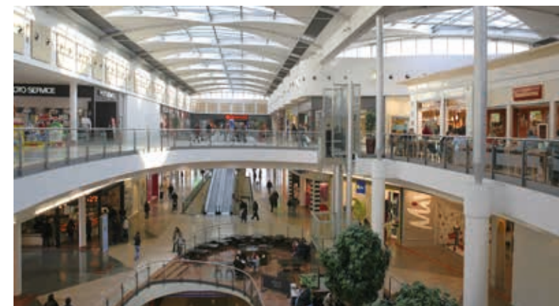
Le centre commercial Côté Seine en plein cœur de la ville

“ Vivante et commerçante, Argenteuil propose une grande variété de loisirs culturels et sportifs pour tous les âges et de nombreux commerces de qualité. ”