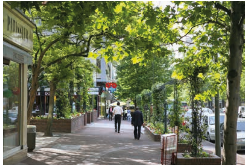
Commerçante et verdoyante, l'avenue Gabriel Péri est à proximité de la résidence.

Parfaitement desservie par les transports, directement connectée à Paris ou la Défense, la ville séduit les familles et Argenteuil, très bien équipée en écoles ou en infrastructures culturelles et sportives tient toutes les promesses d'une qualité de vie véritable.