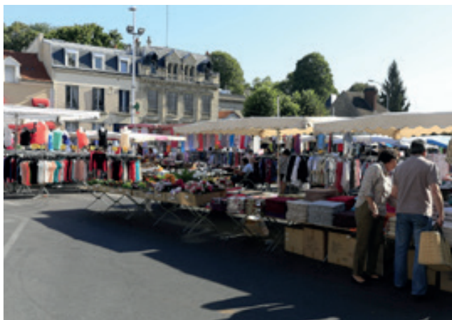
Le Marché de Sannois