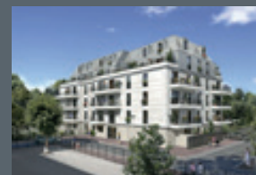
Prima Verde Rue Jean Mermoz 95110 Sannois*