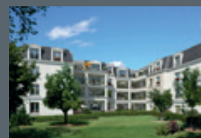
Le Carrousel des Loges Rue des Loges 95110 Sannois