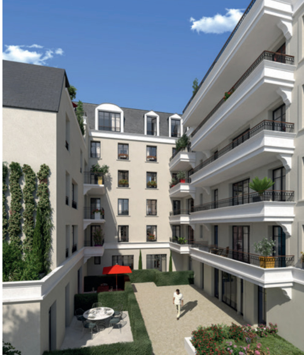
Vue sur la réalisation depuis le cœur d'îlot

L'intérieur de la résidence Le Mansart a été conçu pour proposer aux habitants un confort de vie. Grâce à de belles baies vitrées, les séjours laissent pénétrer la lumière extérieure qui sculpte les volumes intérieurs. Des arbres choisis pour la beauté de leur ramure offrent une vue arborée en cœur d'îlot.