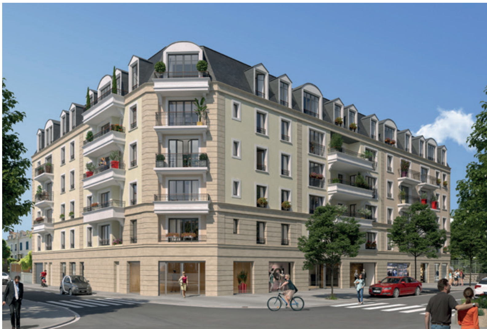
Vue sur la façade de la résidence Le Mansart depuis le boulevard Charles de Gaulle

Au rez-de-chaussée de cette résidence intimiste, des commerces animeront ce quartier préservé.