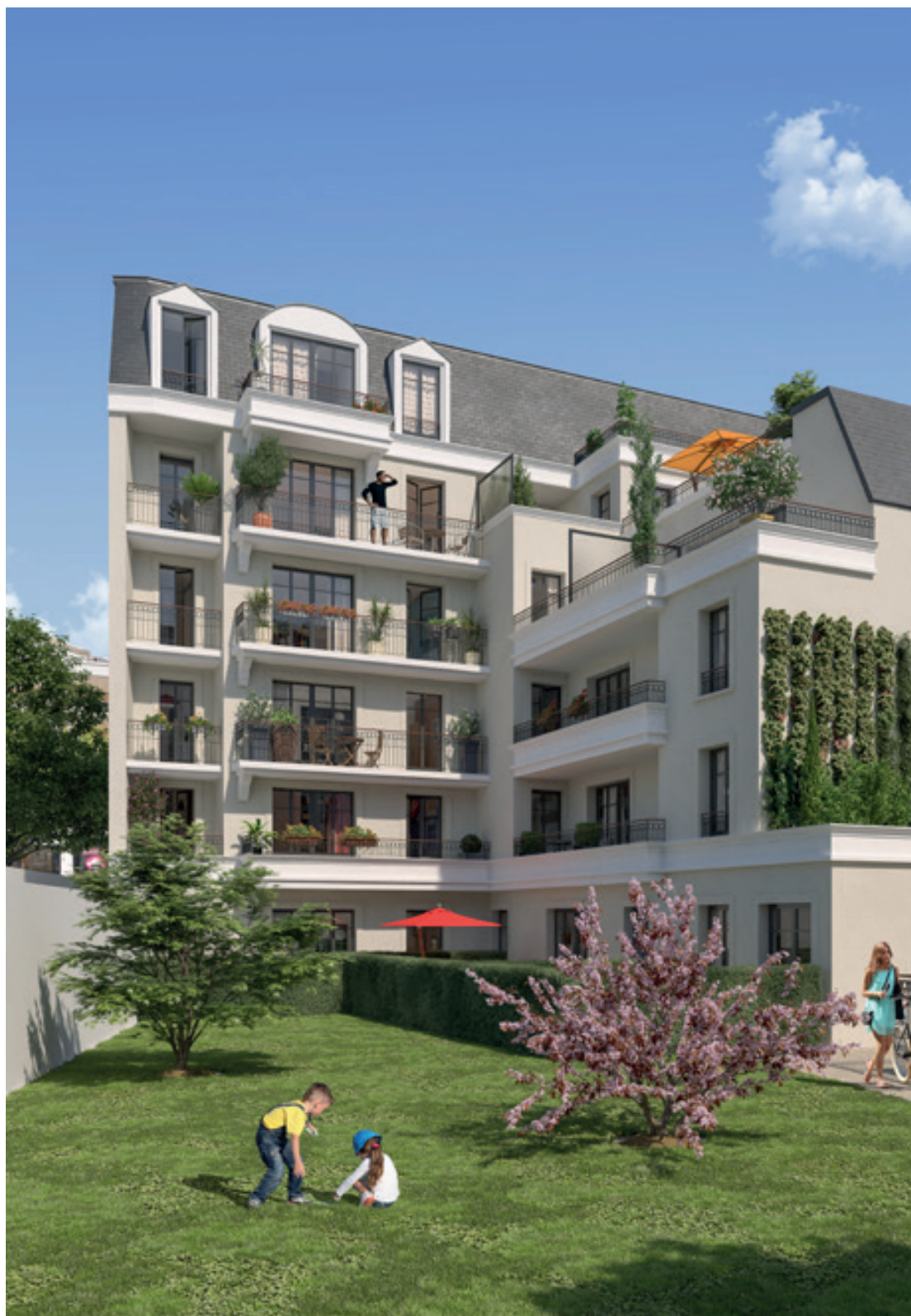
Vue sur le jardin et la résidence Le Mansart

Le hall de la résidence fait référence à ce peintre emblématique.