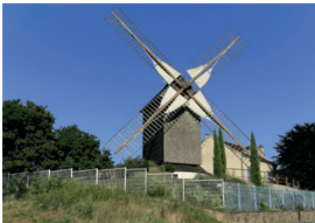
Le Moulin de Montrouillet