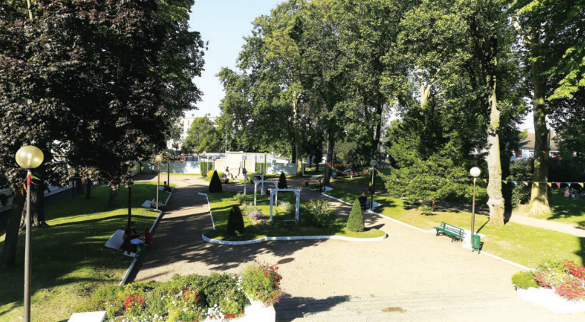
Le Square Jean Mermoz